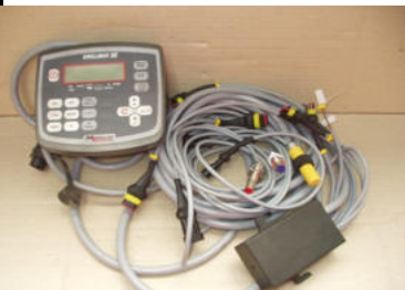
Elektronické koľajové riadky pre rytmus 3, 4S, 5, 6S, 7, 8S, 9