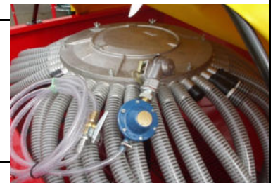
Pneumatické koľajové riadky