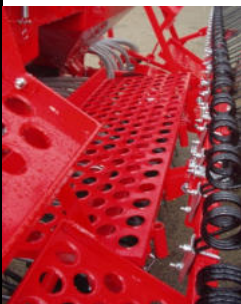
Plošina k schodu