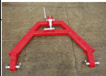
A-záves (pre pripojenie na stroje na prípravu pôdy)