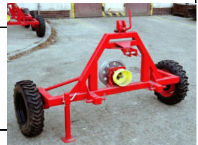
Univerzálny podvozok UNP